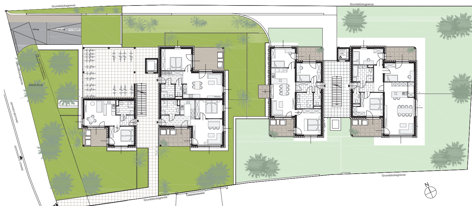
BK 1 ERDGESCHOSS BK 2 1.OBERGESCHOSS