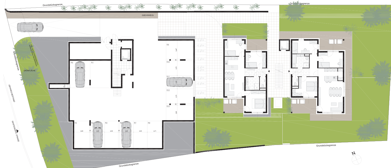
BK 1 TIEFGARAGE BK 2 ERDGESCHOSS