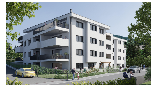
WA STEINA - Steinach am Brenner