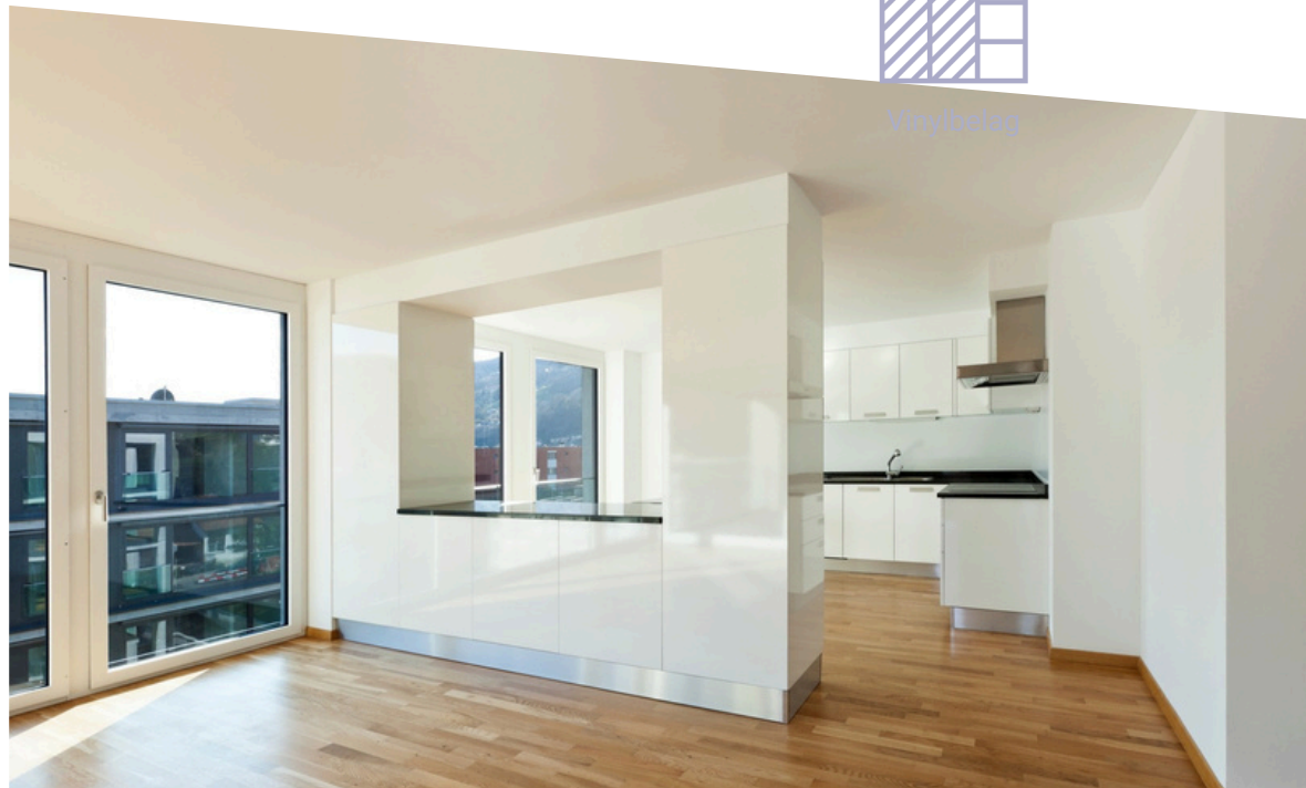
Fiktives Beispielbild einer Wohnung