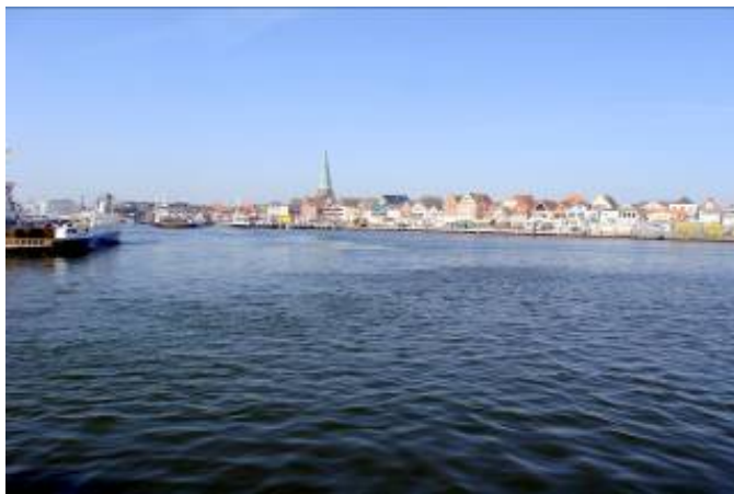
Lübeck Travemünde Priwall

Die Ostsee, hier Travemünde Priwall, erreichen Sie in ca. 15 km oder wer's ruhiger mag fährt nach Rosenhagen.