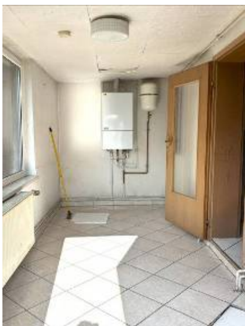
Flur Eingang Hofseite m. Heizung

ca. 84 m 2 , 4 Zimmer, Bad, Küche und Nebenraum.