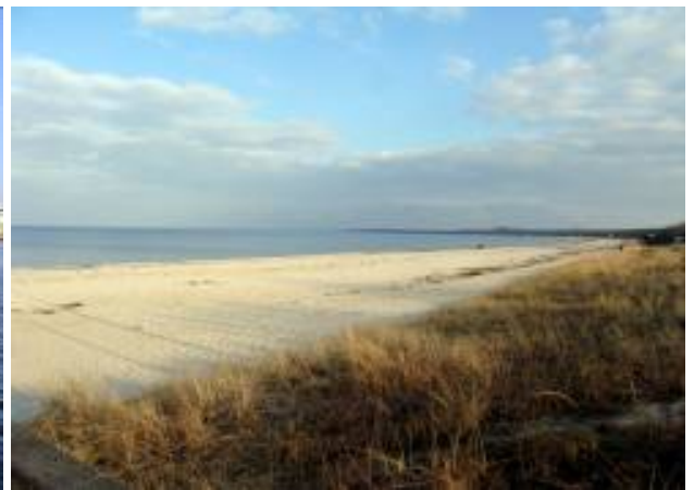
Strand bei Rosenhagen