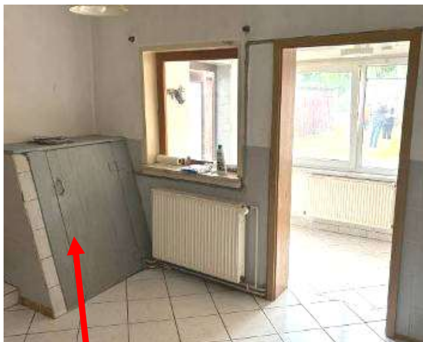
Küche mit Zugang zum Keller