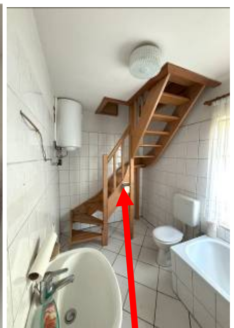
Bad Zugang Dachgeschoß