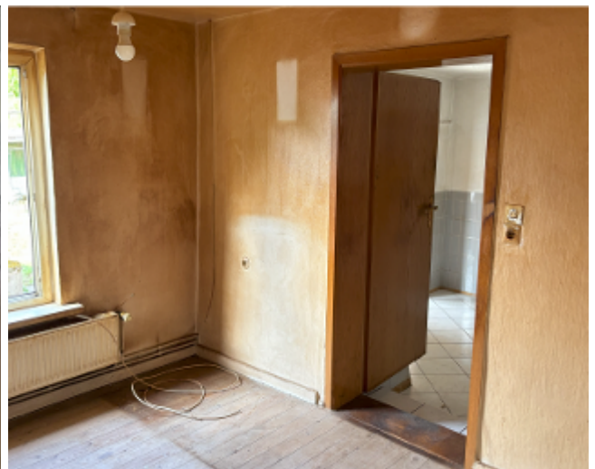
Zwei weitere Zimmer