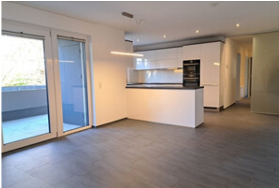
Essen / Kochen