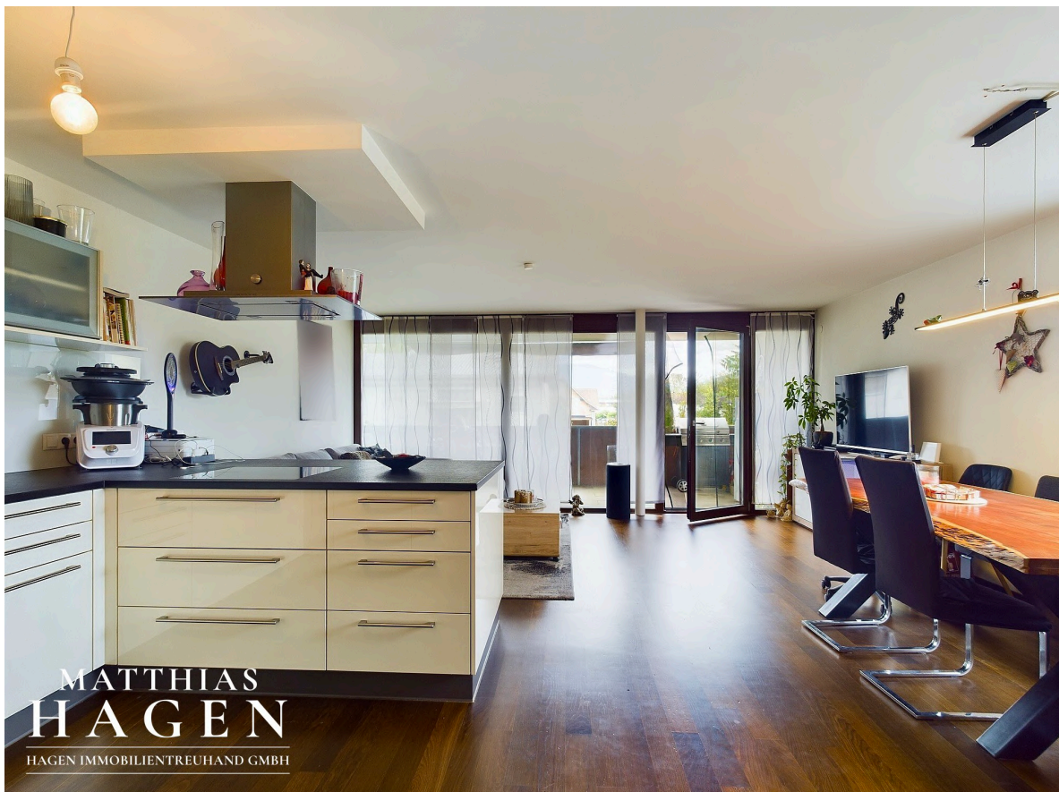
Wohnbereich mit Küche