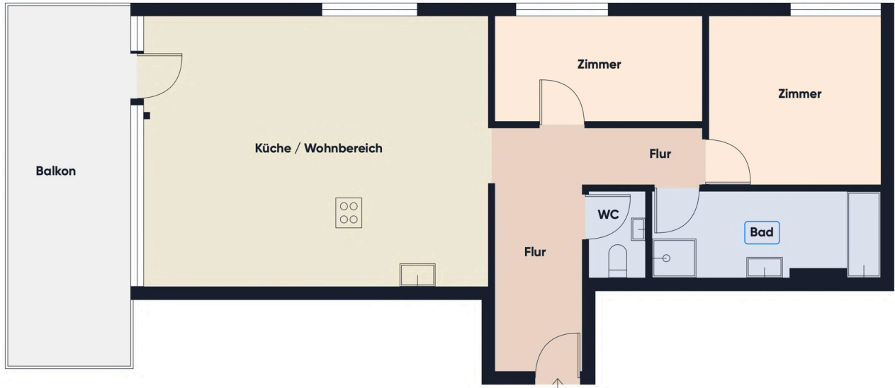
Grundrissplan ohne Maßstab