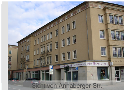
Sicht von Annaberger Str.