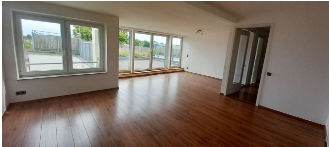
Wohnzimmer Ansicht II