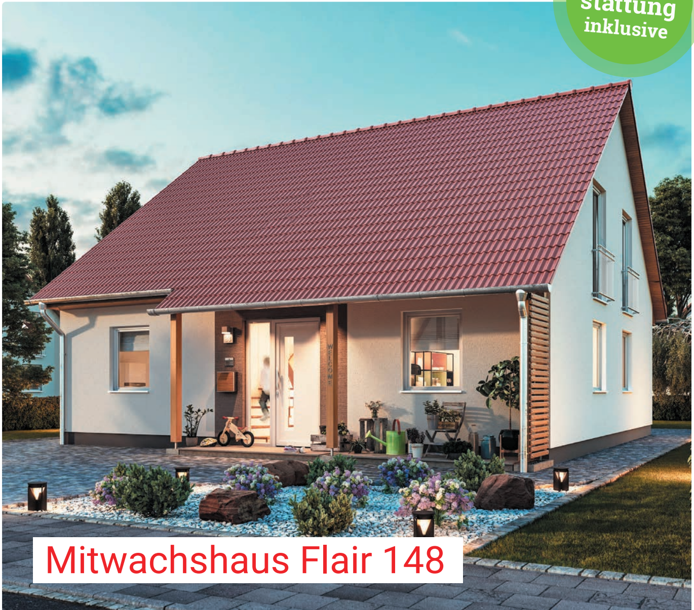
Mitwachshaus Flair 148