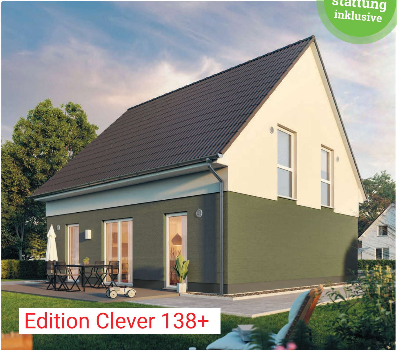
Edition Clever 138+