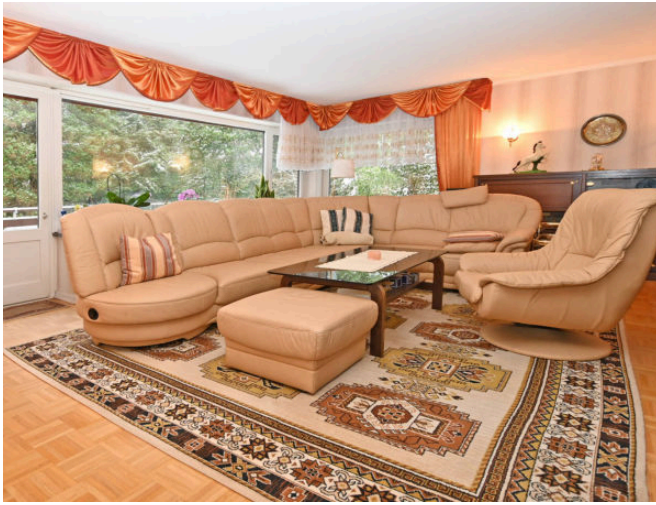
Wohnzimmer mit Balkon Eg.