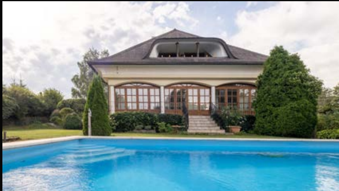
TRAGWEIN: GEPFLEGTES ANWESEN MIT TRAUMHAFTEN GARTEN UND GROSSEM POOL

4284 Tragwein VERMITTELT Wohnfläche: 285 m 2