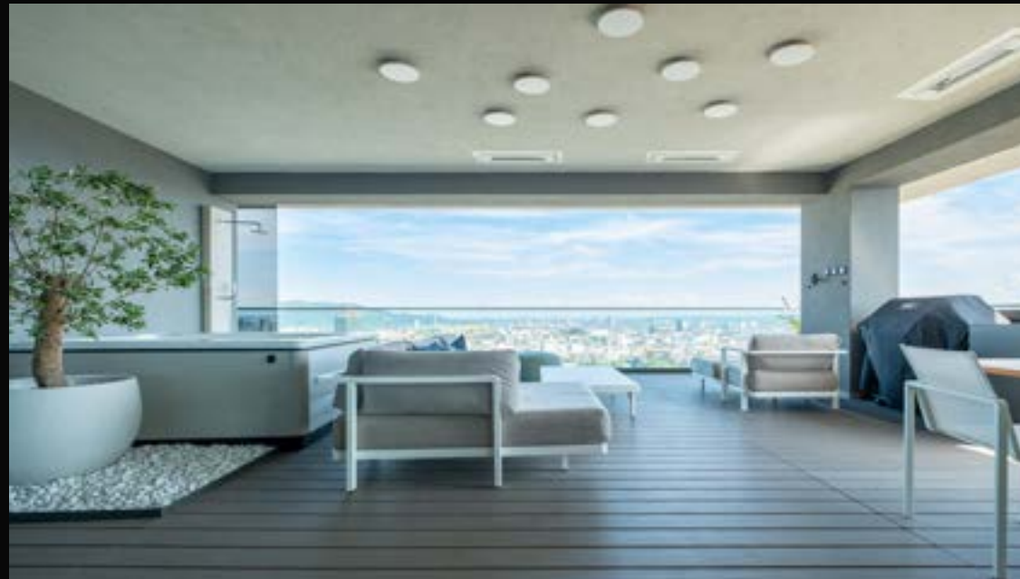
LINZ BRUCKNER TOWER: EXKLUSIVES WOHNEN ÜBER LINZ - EINE EINMALIGE GELEGENHEIT

4284 Tragwein VERMITTELT Wohnfläche: 285 m 2