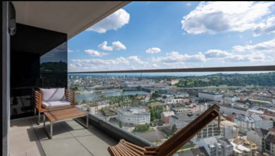
LINZ: BRUCKNER TOWER. SONNIGES MICRO LOFT MIT TRAUMHAFTER AUSSICHT

4020 Linz VERMITTELT Wohnfläche: 150 m 2