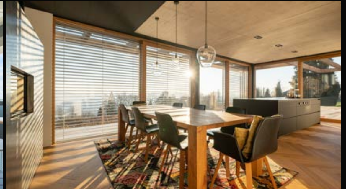
LINZ PÖSTLINGBERG: STILVOLLES ANWESEN I PREMIUM LAGE

4040 Linz VERMITTELT Wohnfläche: 136 m 2