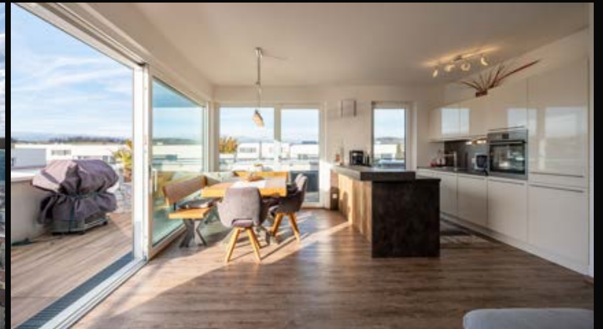
PASCHING: NEUWERTIGES PENTHOUSE MIT DACHTERRASSE IN PASCHING

4061 Pasching VERMITTELT Wohnfläche: 84 m 2