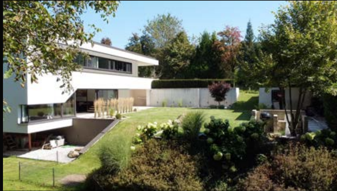
LINZ/KIRCHSCHLAG: SEHR SCHÖNES NEUWERTIGES ARCHITEKTENHAUS

4201 Eidenberg VERMITTELT Wohnfläche: 240 m 2