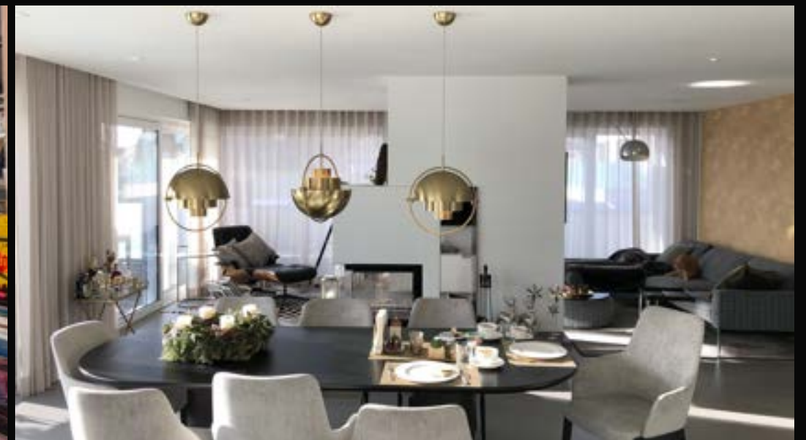
NEUHOFFEN/KREMS: EXKLUSIVE DACHGESCHOSS-WOHNUNG

1180 Wien VERMITTELT Wohnfläche: 100 m 2