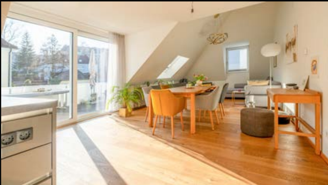
LINZ FROSCHBERG: EXKLUSIVES PENTHOUSE AM FROSCHBERG

4020 Linz VERMITTELT Wohnfläche: 160 m 2