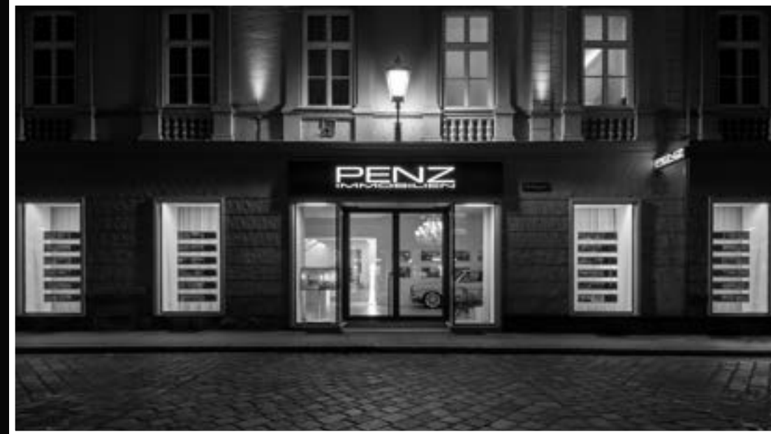
Domgasse 5 4020 Linz