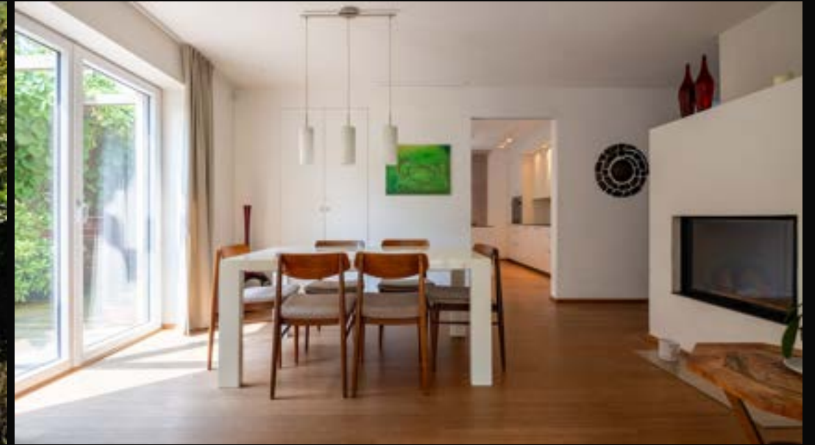
LINZ: STADTHAUS MIT UNEINSEHBAREM GARTEN & EXTRA PRAXIS/BÜRO

4202 Kirchschlag VERMITTELT Wohnfläche: 161 m 2