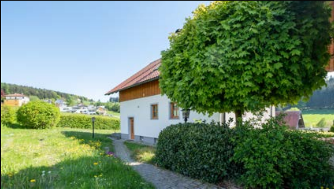
EIDENBERG: SONNIGES LANDHAUS MIT WEITBLICK

4201 Eidenberg VERMITTELT Wohnfläche: 240 m 2