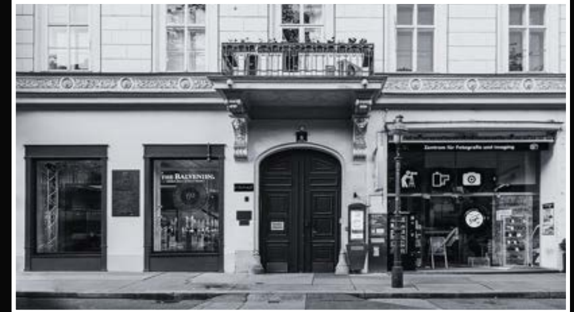
Opernring 6 1010 Wien Innenhof