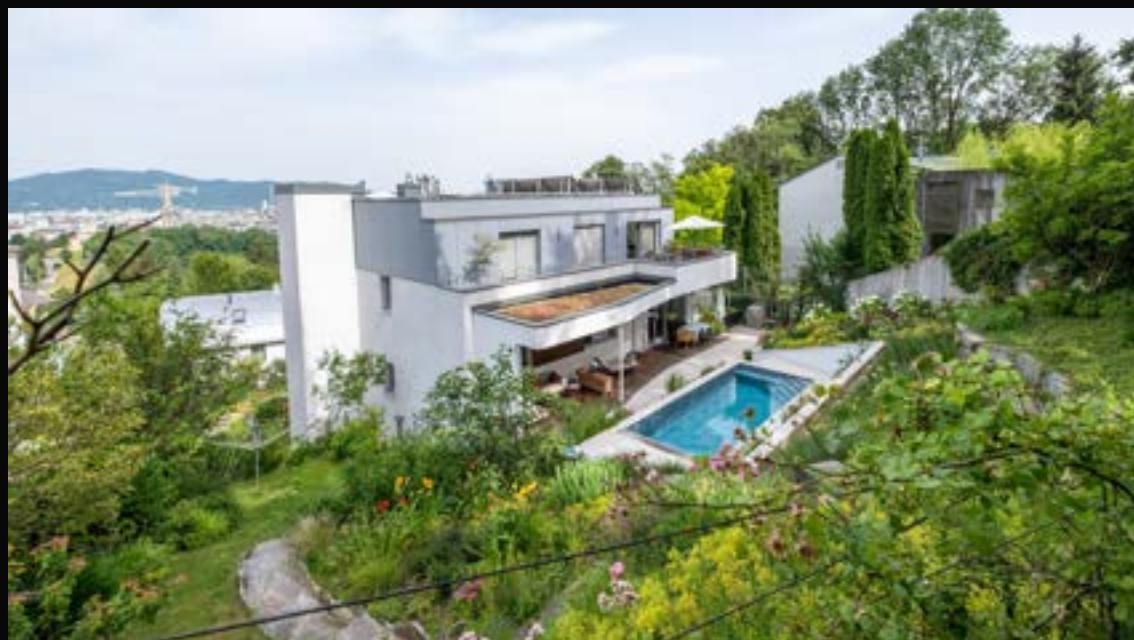
LINZ: EXKLUSIVES WOHNEN MIT POOL AM FREINBERG

4040 Linz VERMITTELT Wohnfläche: 232 m 2