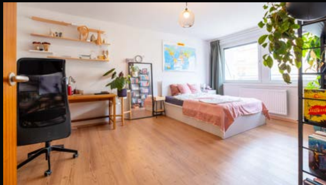
WIEN: 18. BEZIRK - GERÄUMIGE WOHNUNG FÜR FAMILIE ODER ANLEGER

4020 Linz VERMITTELT Wohnfläche: 149 m 2