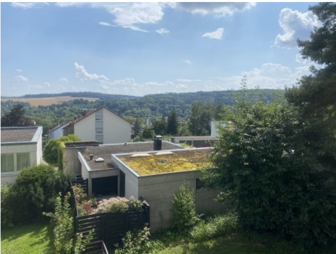
Blick vom Balkon I