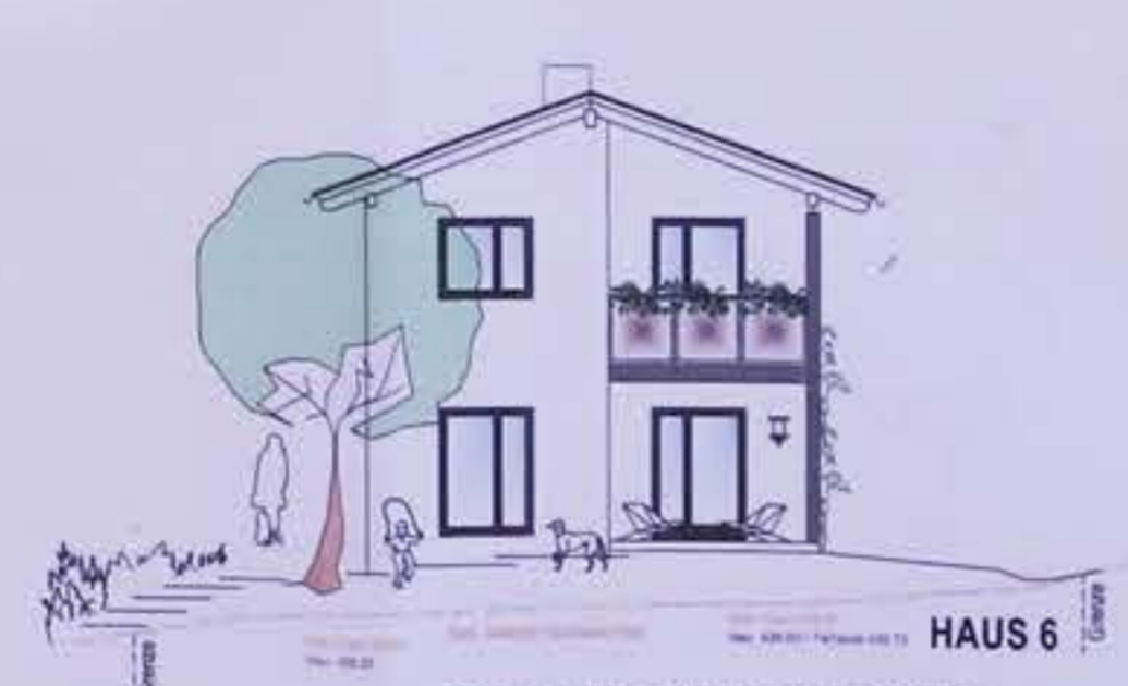
HAUS 6 ANSICHT VON WESTEN