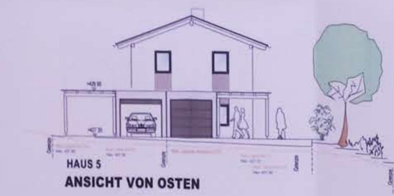
HAUS 5 ANSICHT VON OSTEN