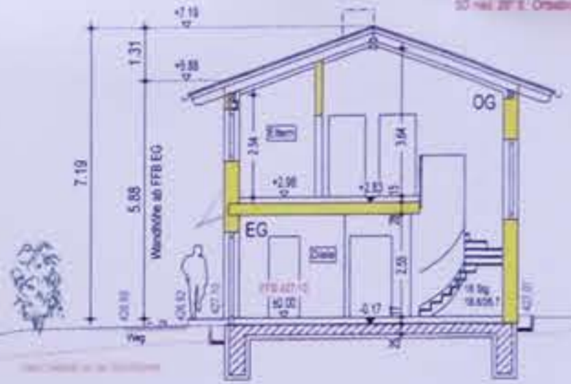
SCHNITT A-A HAUS 5

Naturrote Dachziegel oder ziegelrote Betonplanken aufbringen!