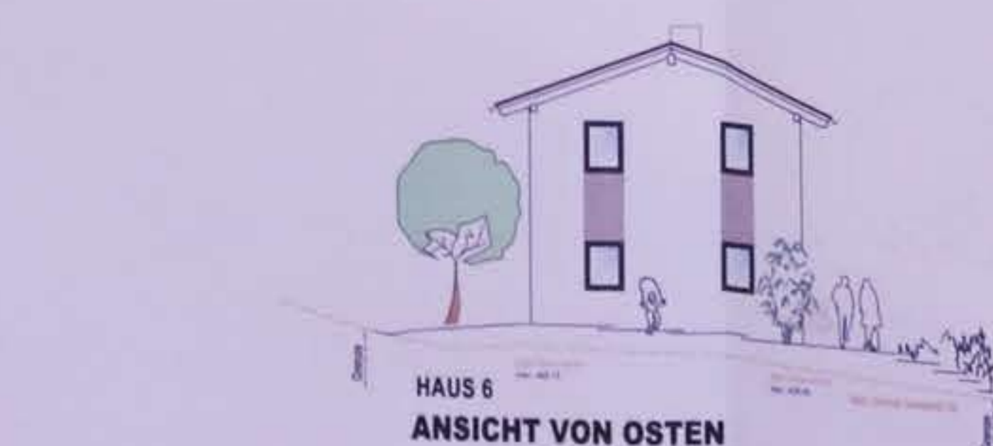
HAUS 6 ANSICHT VON OSTEN