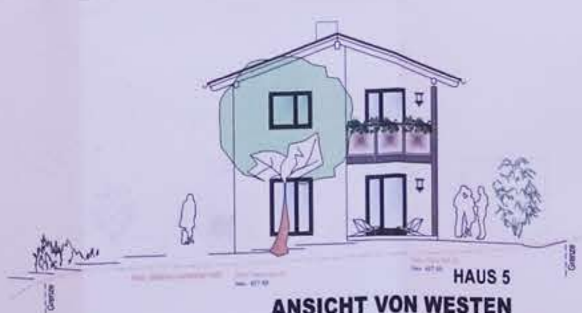
HAUS 5 ANSICHT VON WESTEN