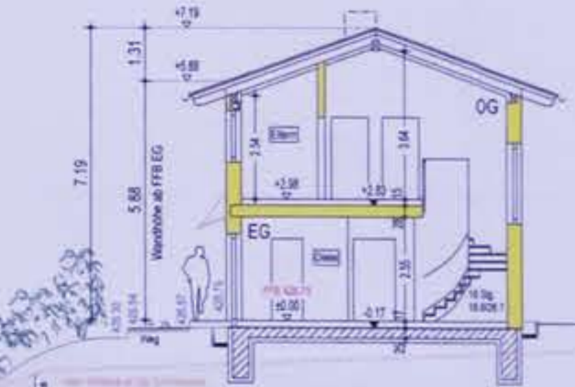
SCHNITT B-B HAUS 6