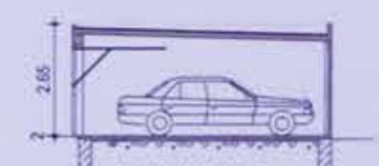
SYSTEMSCHNITT FERTIGGARAGEN Haus 5-8 (OK Pflasterhöhe Einfahrt siehe Grundris EG)

Wärmedämmung nach ENEC-Berechnung Drainage bei Bedarf einbauen Tragende Teile nach statischer Berechnung Fundamente frostfrei gründen Höheanlage bewerkstelligen