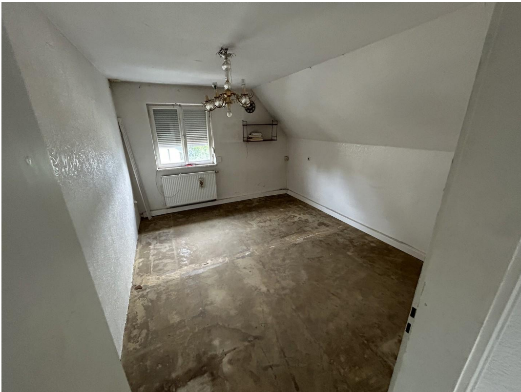
Zimmer 2 (OG)