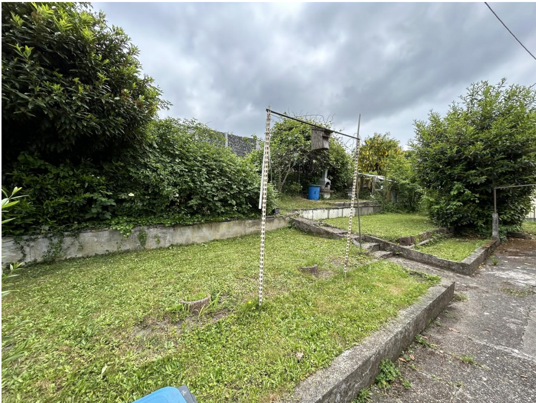
Gartenfläche v. d. Eingangstür