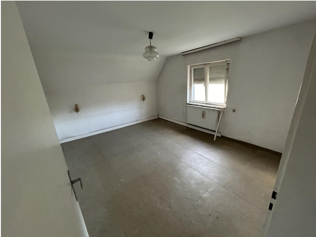
Zimmer 1 (OG)