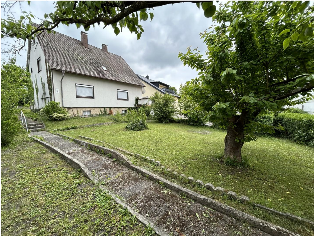
Außenansicht & Garten