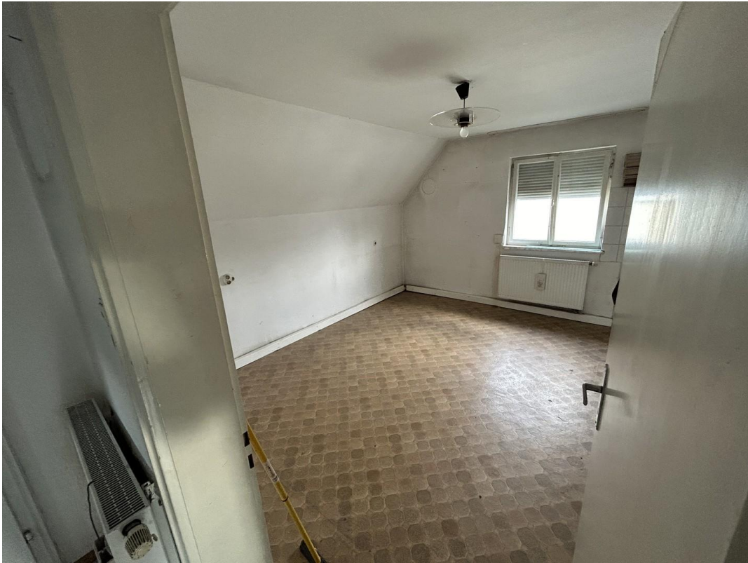
Zimmer 3 (OG)