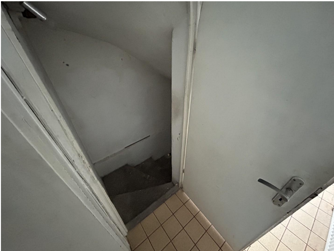
Zugang zum Keller