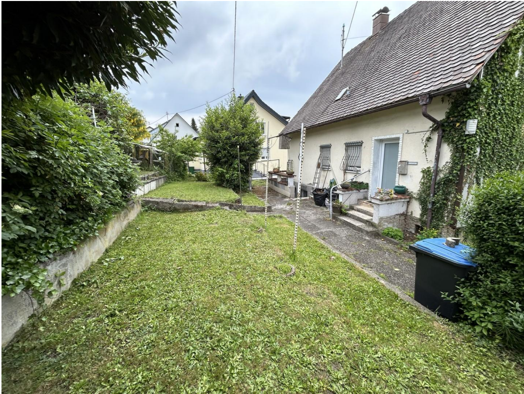
Garten & Eingangsbereich