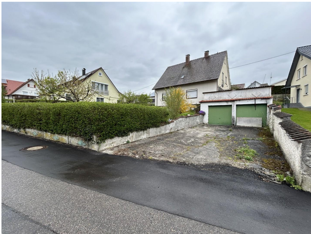
Außenansicht mit Garagen