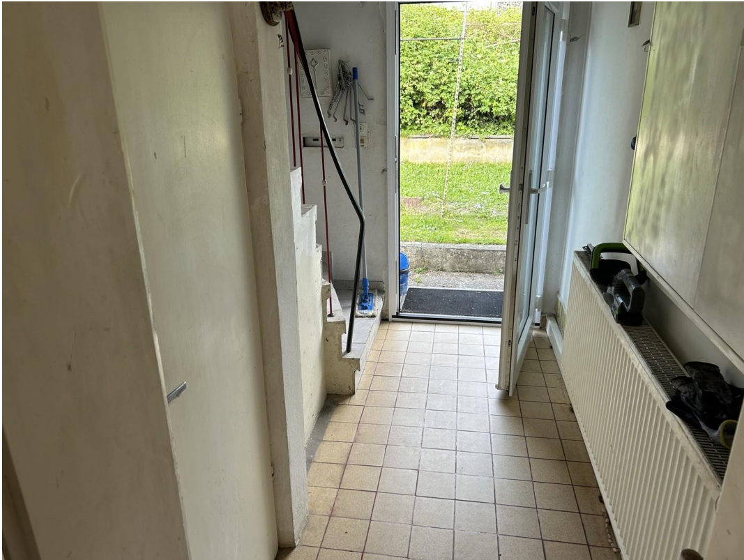
Eingangsbereich v. innen (EG)