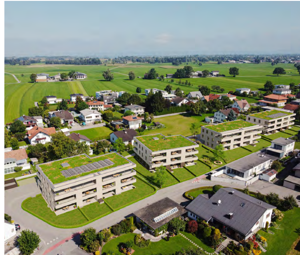
Ein besonderes Zuhause Schön geschnittene Grundrisse, südlich liegende Terrassen bzw. Loggien und Grünräume, die zum Verweilen einladen – das ist Wohnen in der Wohnanlage Wiesenstraße.

Huber ZT Kaiser-Franz-Josef-Straße 4a A-6890 Lustenau