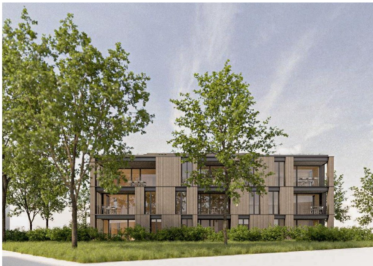
Ansicht Süd Ost