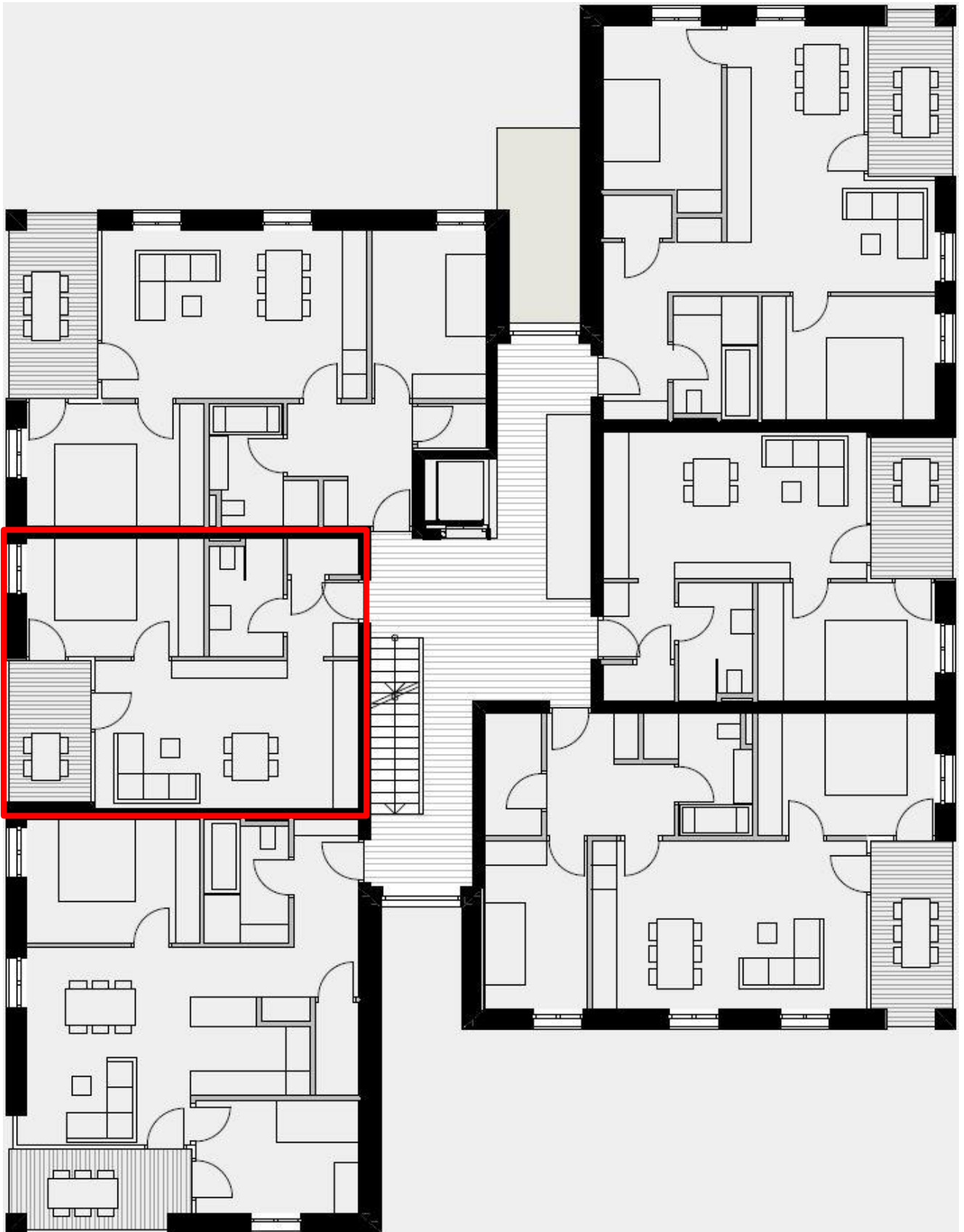
Stockplan 2. OG