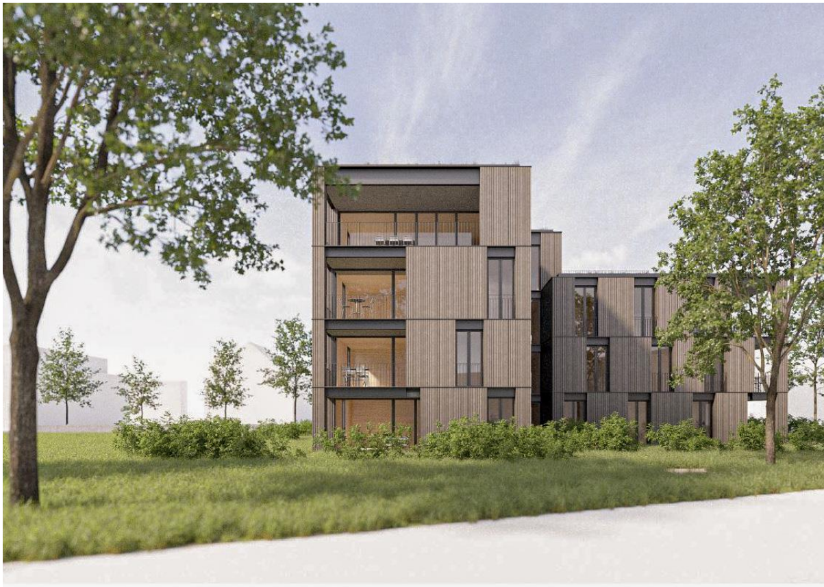
Ansicht Süd West