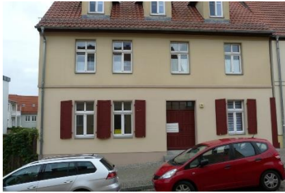
Abbildung 1: Front

Anschrift: Neue Bergstr. 14, 16259 Bad Freienwalde