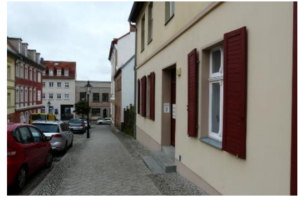
Abbildung 3: Neue Bergstr.