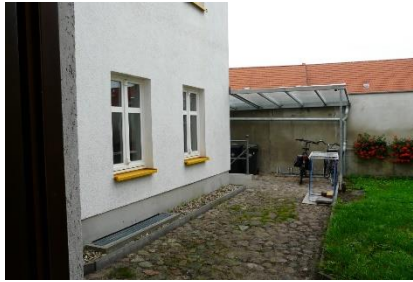
Abbildung 2: Hof