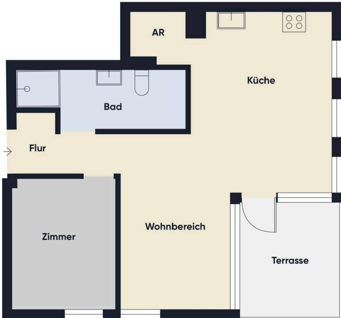
Grundrissplan ohne Maßstab