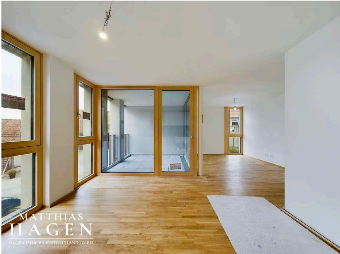
Wohnbereich mit Küche