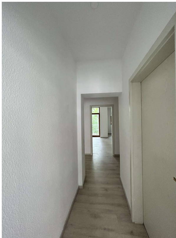
Zugang zum Flur