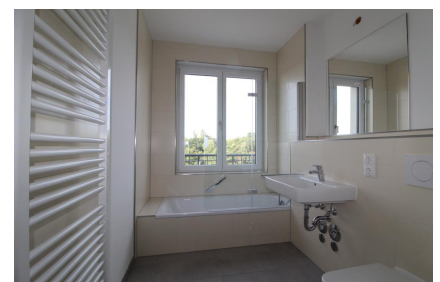
Tageslichtbad mit Wanne