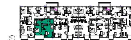
Haus B: Grundriss 2. Obergeschoss