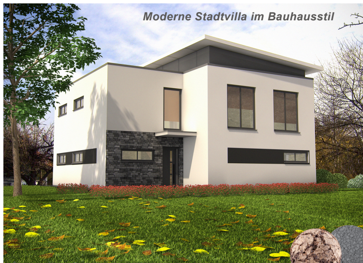
Moderne Stadtvilla im Bauhausstil

WOHNTON Massivhaus liefert die gesamte technische Bearbeitung, Service, Produktion und Montage aus einer Hand. Natürlich sind bei der Planung den individuellen Wünschen und der Kreativität unserer Kunden keine Grenzen gesetzt, denn wir bauen kein Haus von der Stange.