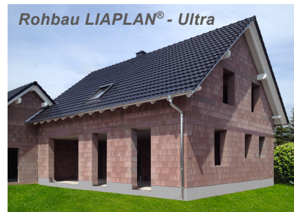
Rohbau LIAPLAN® - Ultra

Viele unserer Bauherren werden dieser Verantwortung beim eigenen Hausbau gerecht. Hierbei ist die Wahl des Wandbaustoffes eine der wichtigsten Entscheidungen für Ihr späteres Wohlbefinden im neuen Heim.