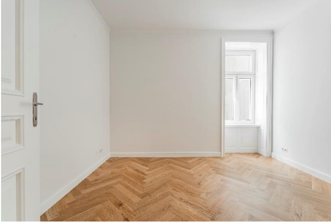
Parkett Eiche Fischgrät