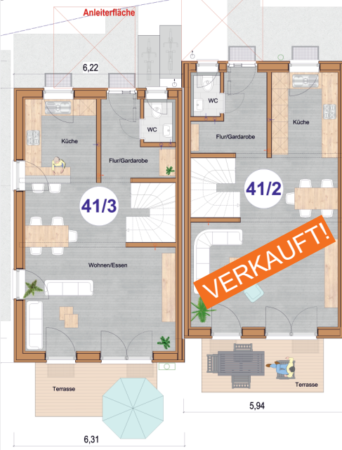
Darstellung nicht maßstäblich, unverbindlicher Grundriss

++ moderne Architektur ++ tolle Grundrisse mit bis zu 6 Zimmern und 2 Bädern ++ ca. 121 - 124m 2 Wohnfläche ++ 2 Kfz-Stellplätze ++ Süd-West-Terrasse mit Garten ++ Vollkeller ++ Top-Wärmepumpe ++ modernste Passivhaustechnik mit Erdwärmenutzung ++ Frischluft-Klima mit sommerlicher Kühlung ++ Solarstrom-Anlage mit Batteriespeicher ++ prima Verkehrsanbindung Rtg. Stuttgart + Aalen über die B29 + MEX (Haltestelle in Urbach) ++ günstige Finanzierung ++ Sommer-Highlight: Nähe zum Freibad & Natur ++ Einzug ab 08/2024 möglich ++