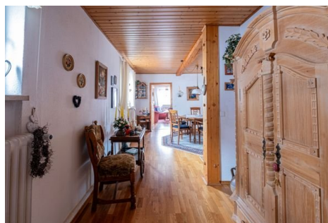
Durchgang zum Esszimmer / Küche