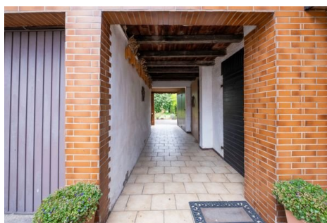
Durchgang zum Garten