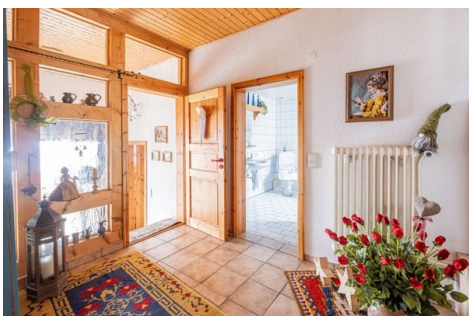
Hauseingang / Flur