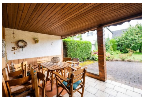
Überdachter Freisitz im Garten