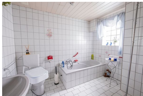
Tageslichtbad im UG