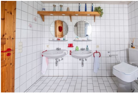
Tageslichtbad im UG