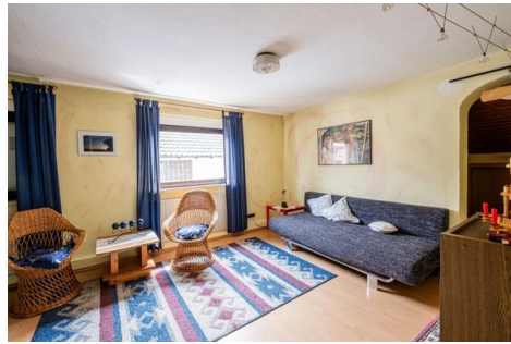
Zimmer im OG