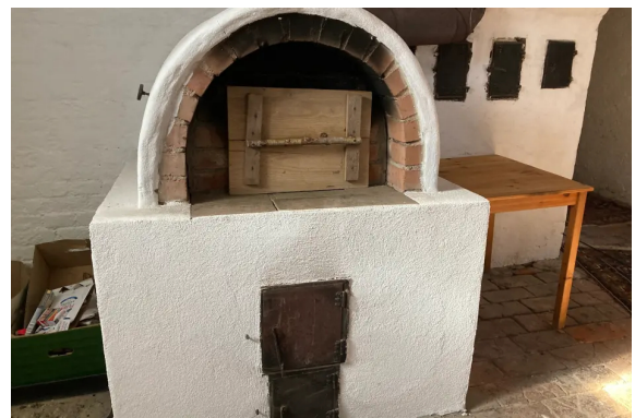
Pizzaofen im Ritterstübe