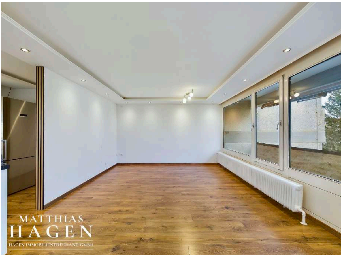
Küche und Wohnbereich