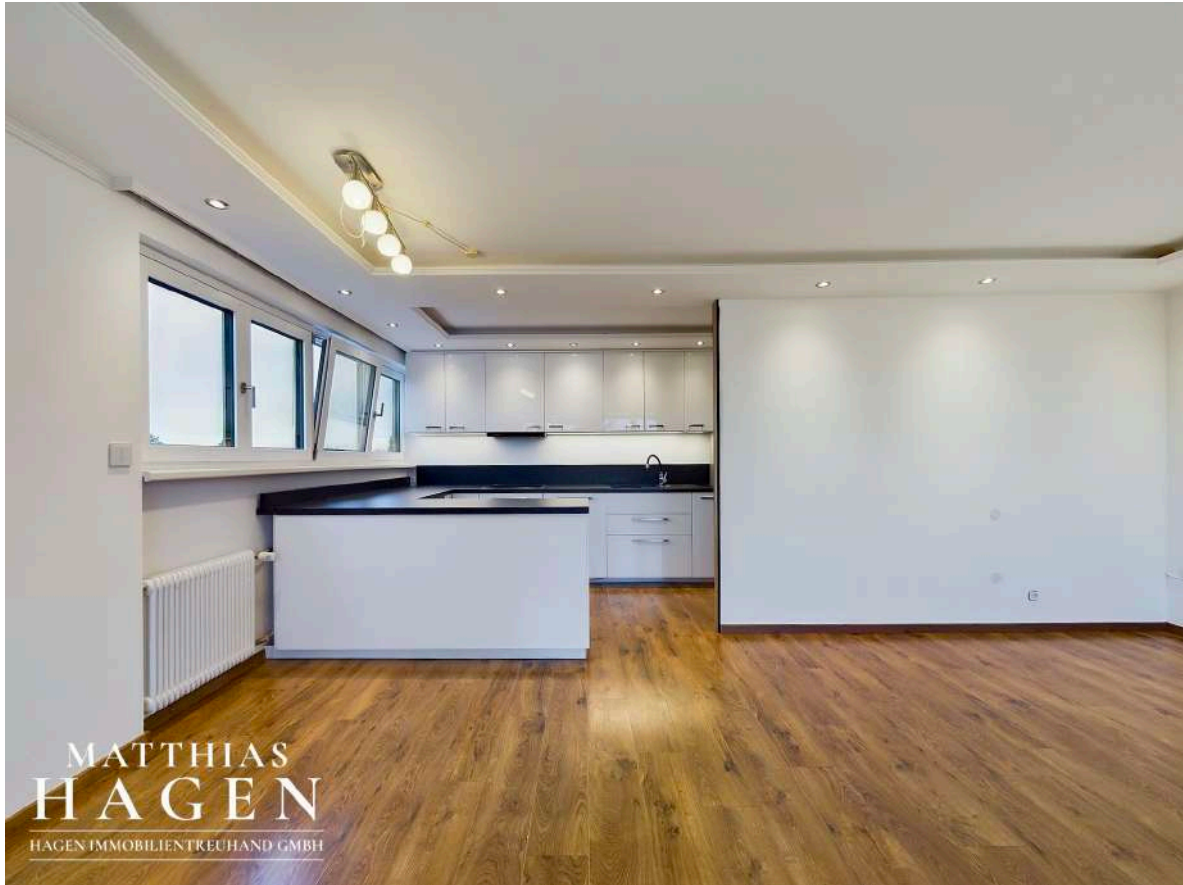
Küche und Wohnbereich