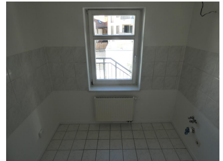
Küche mit Fenster