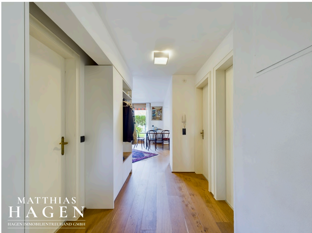
Wohnbereich mit Küche

MATTHIAS H A G E N HAGEN IMMOBILIENTREUHAND GMBH