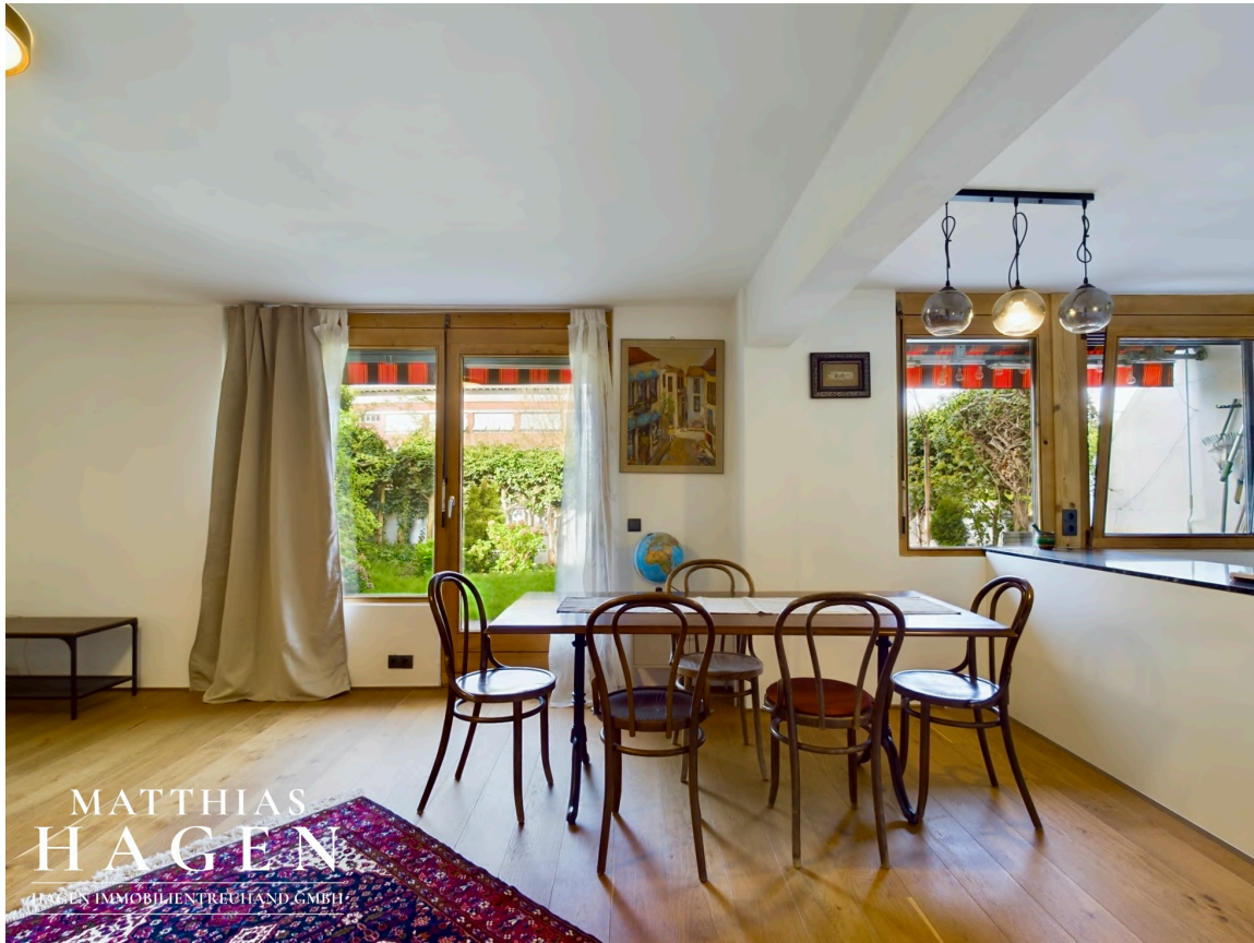
Wohnbereich mit Küche