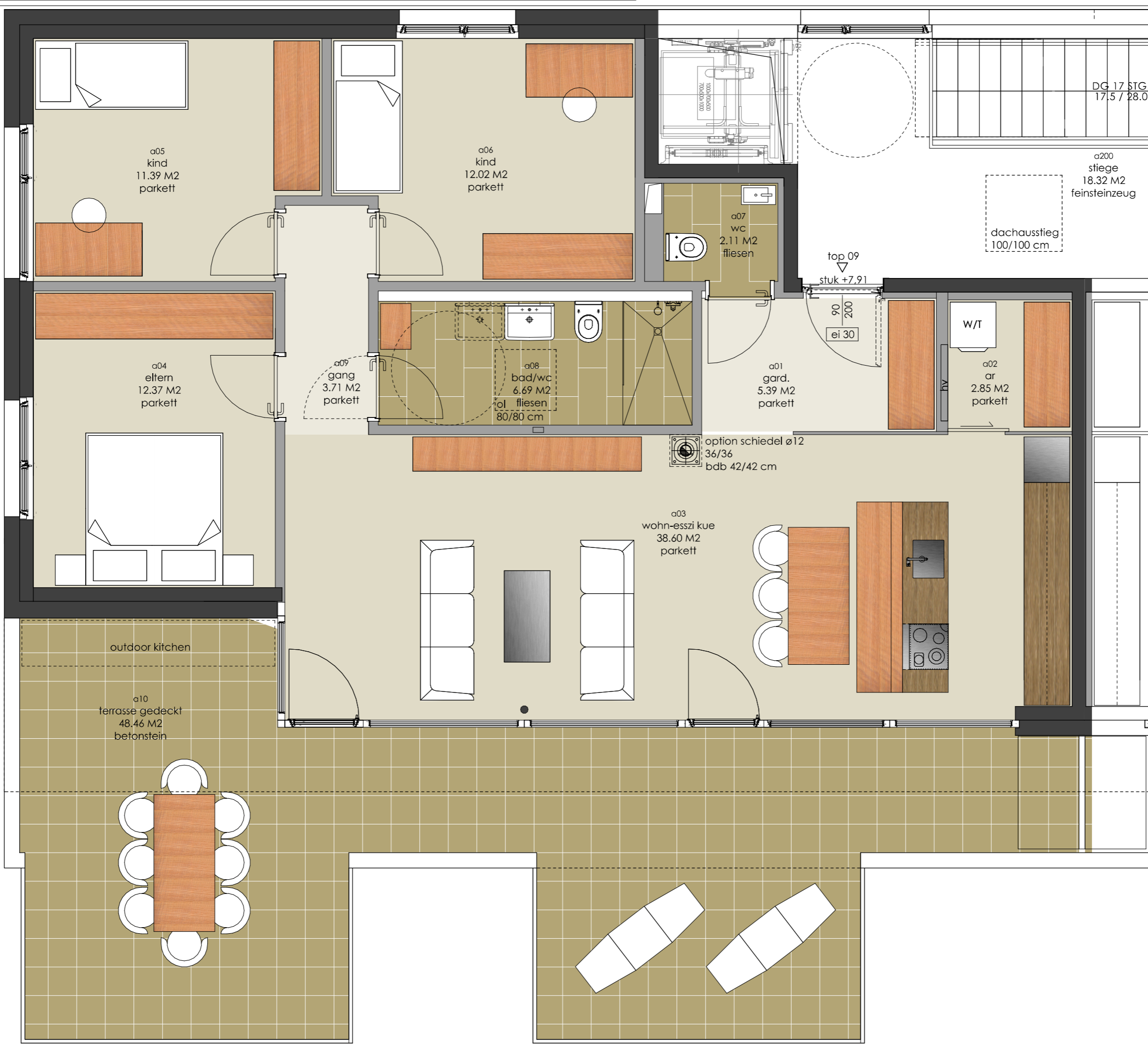
4-ZI PENTHOUSE 95,13 M2