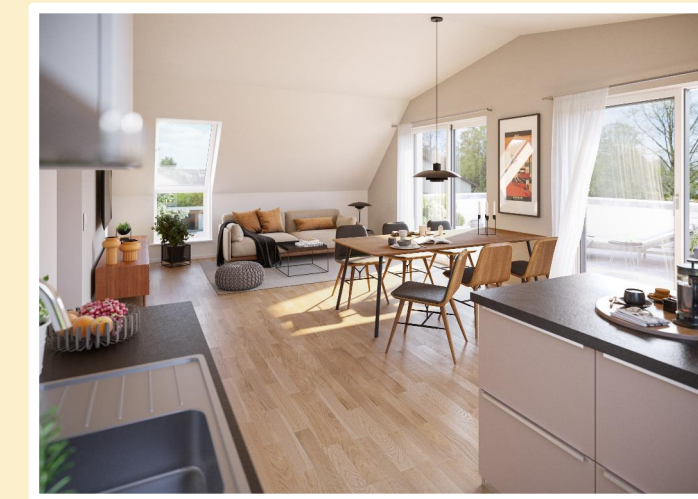
VISUALISIERUNG WOHNZIMMER DG