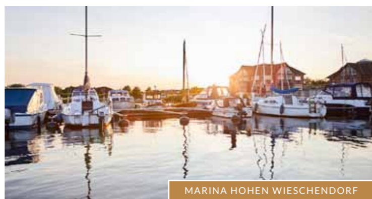
MARINA HOHEN WIESCHENDORF