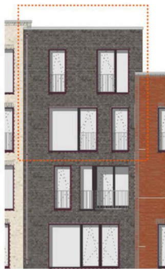
Ansicht Nord M 1:200