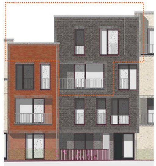
Ansicht Süd M 1:200