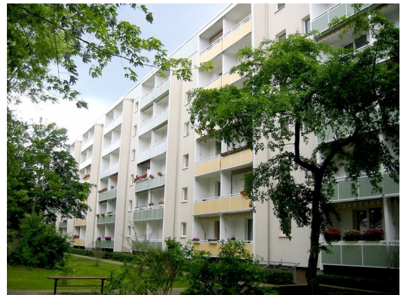
Hoch hinaus - Aktion Kaltmiete erlassen