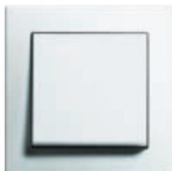
Reinweiß seidenmatt (ähnl. RAL 9010)

Die Ausstattung entspricht der Planung zum Stichtag 20.07.2024. Die Ausführung wird entsprechend der Verfügbarkeit der Produkte angeglichen. Beschriebene Ausstattungsmerkmale können durch gleichwertige oder ähnliche ersetzt werden.