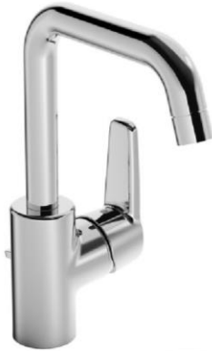
Waschtischarmatur chrom mit Ablaufgarnitur