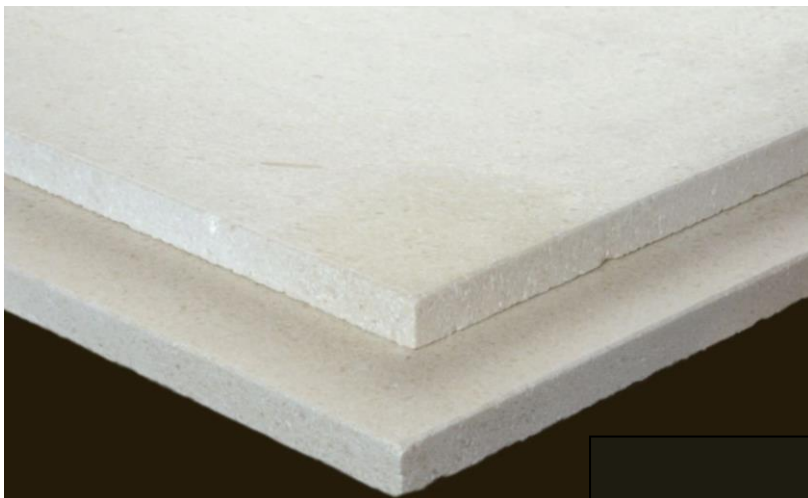
Kalkstein Miros, Material 556, gebürstet