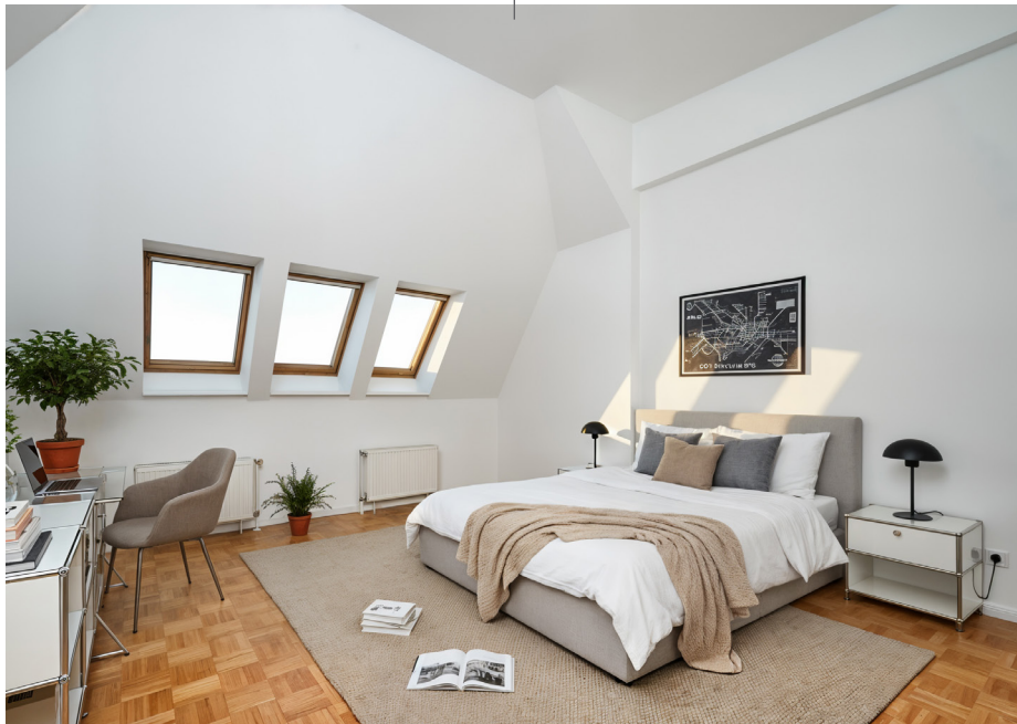
Unverbindliches Wohnungsbeispiel | Non-binding flat example