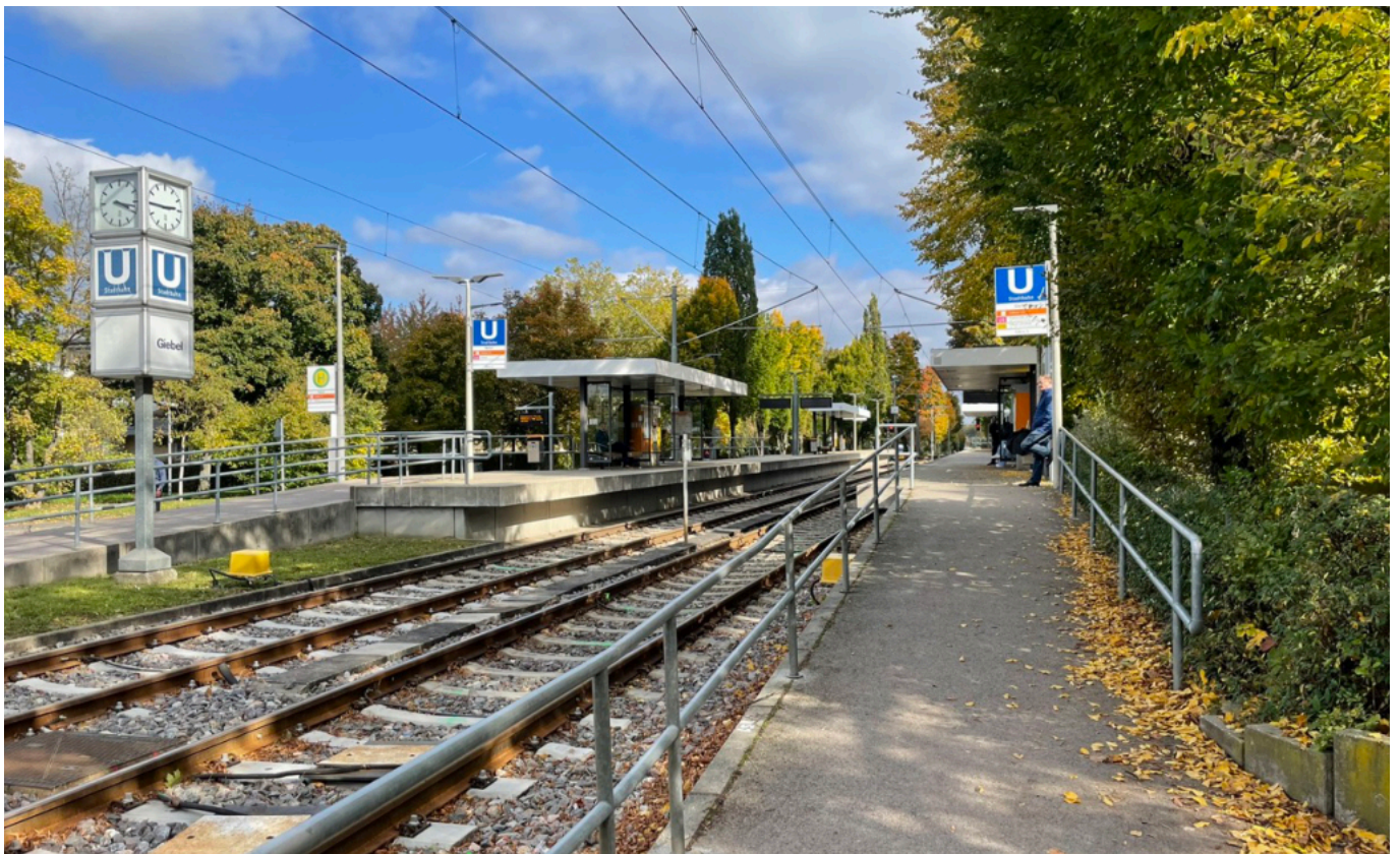
stadtbahn direkt vor dem haus

Die Warmwasseraufbereitung erfolgt über einen dezentralen Warmwasserspeicher, der im Abstellraum platziert ist.