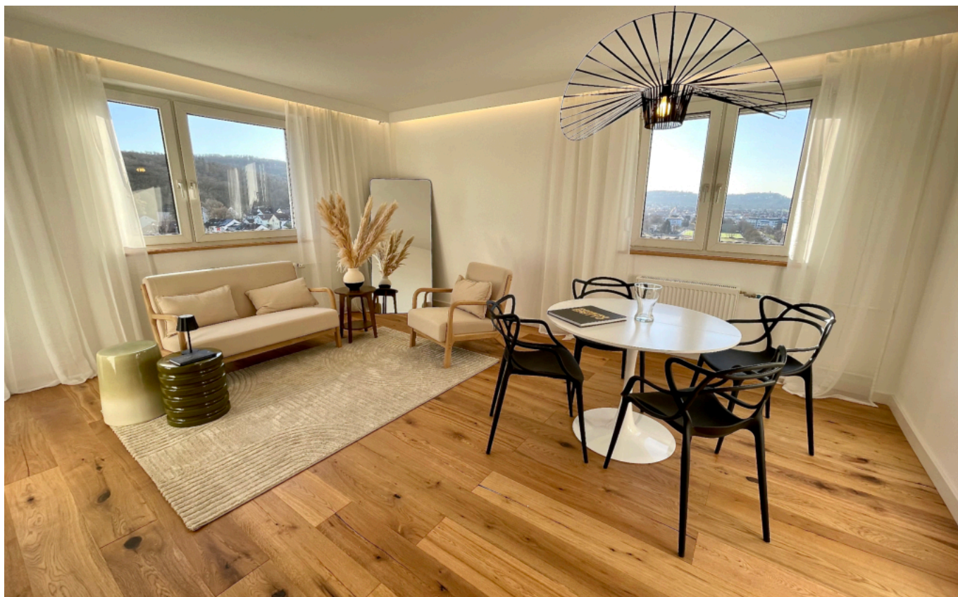
wohnen / essen