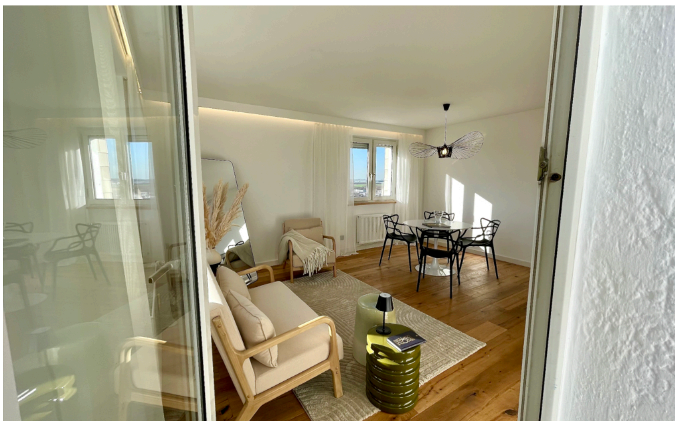
wohnen / essen