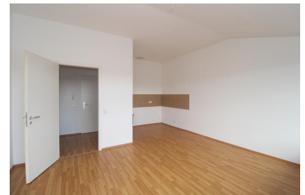
Wohnen mit Kochbereich