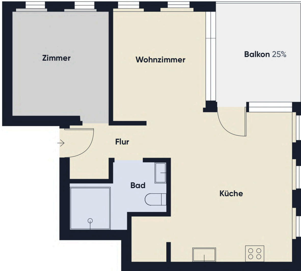
Grundrissplan ohne Maßstab