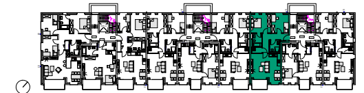
Haus A: Grundriss 2. Obergeschoss