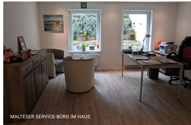
MALTESER SERVICE-BÜRO IM HAUS

Das Leistungsangebot im Haus Geroweier ist modular aufgebaut: Zum Grundleistungspaket, welches als soziales Netz und fester Unterstützungsbestandteil des täglichen Lebens gilt, können verschiedene Wahlleistungen (z.B. Verköstigung, Sozial- und/oder Pflegeleistungen) ergänzt werden, die entweder vom Malteser Hilfsdienst e.V. vermittelt, oder selbst erbracht werden.