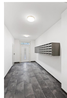
Nebeneingang mit Briefkästen