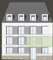
Ansicht von Südosten (Straßenseite)