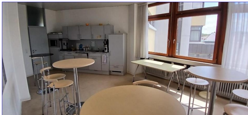
3. OG Cafeteria