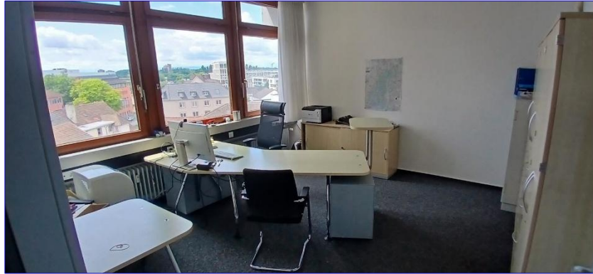
4. OG Büro