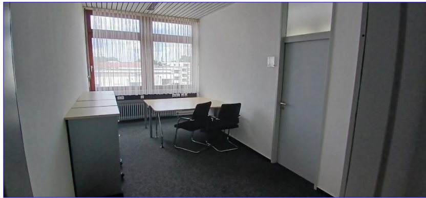
3. OG Büro