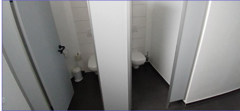
3. OG WC