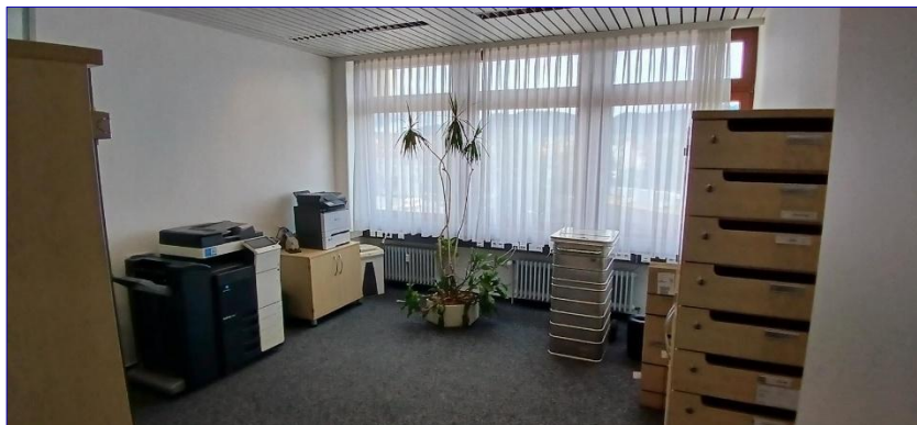
4. OG Büro