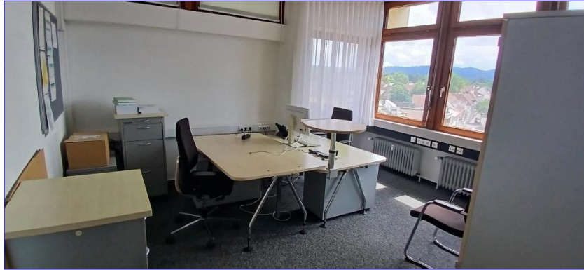
4. OG Büro