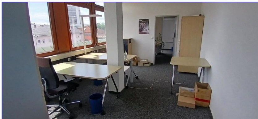
3. OG Büro