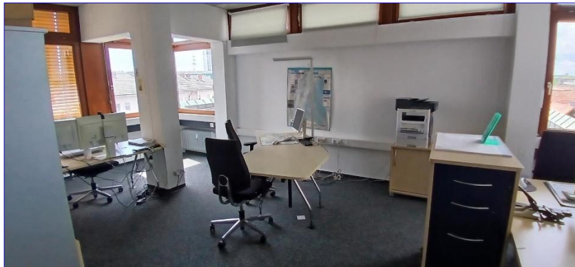
3. OG Büro