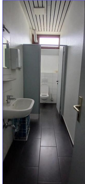
3. OG WC