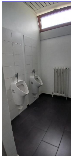
3. OG WC