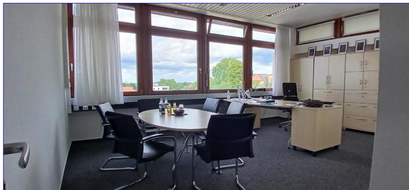
4. OG Büro