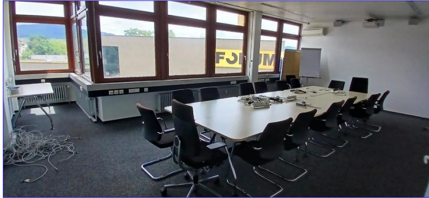
3. OG Büro