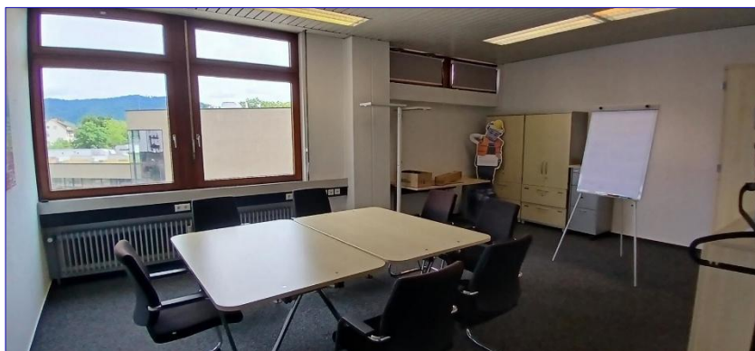
3. OG Büro