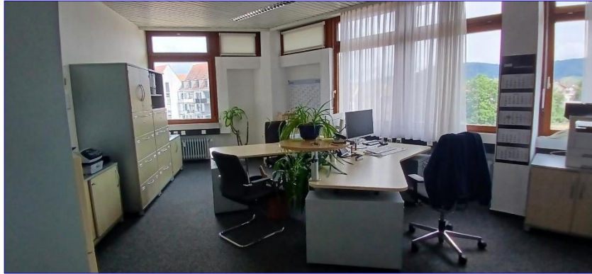
4. OG Büro