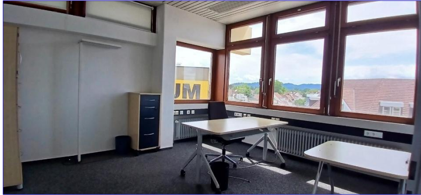
3. OG Büro