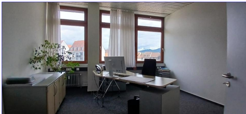
4. OG Büro