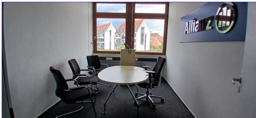
3. OG Büro