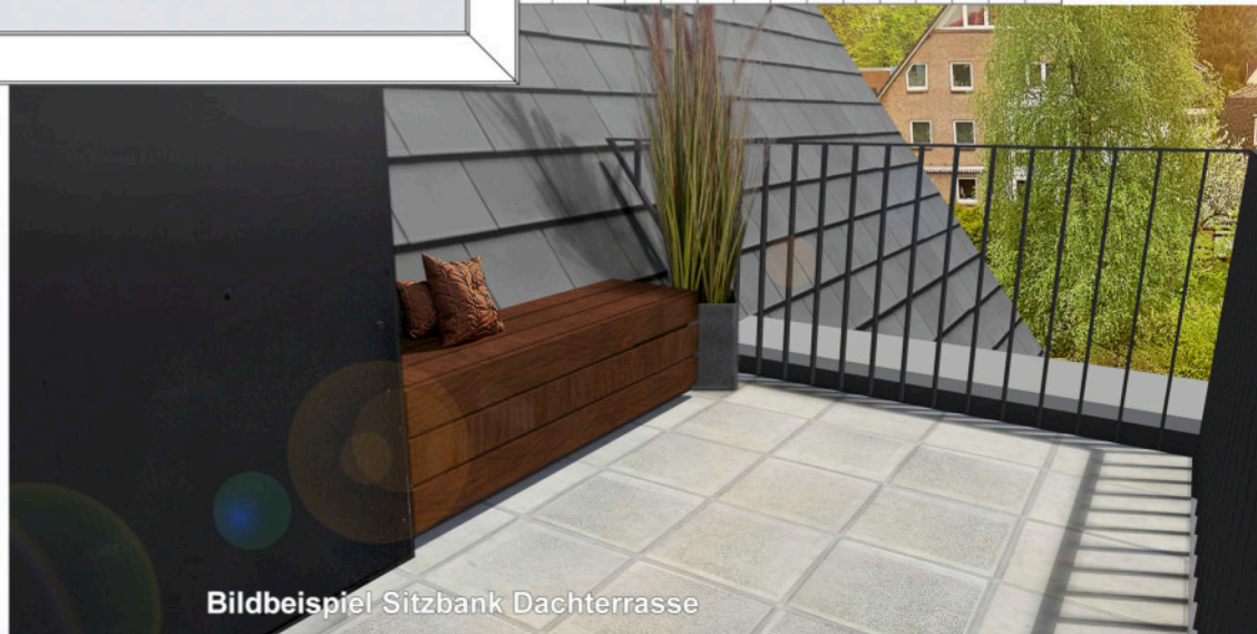
Bildbeispiel Sitzbank Dachterrasse