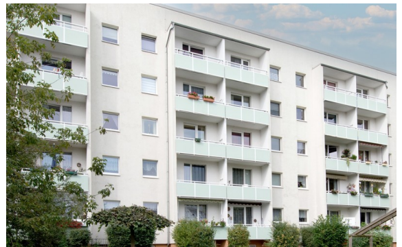
Hoch hinaus - Aktion Kaltmiete erlassen