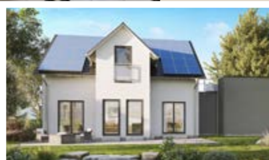
Abbildungen mit Sonderwünschen.