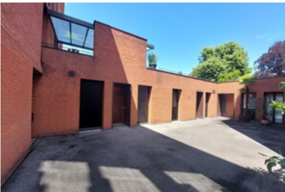
Außenansicht / Innenhof