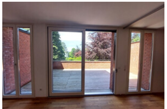
Wohnen / Terrasse