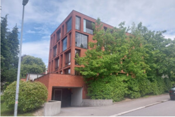
Außenansicht / TG Einfahrt