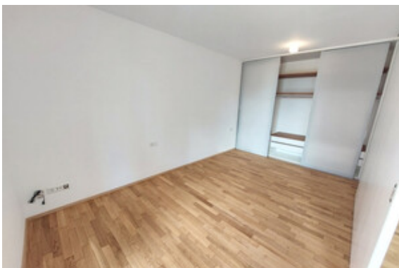
Zimmer / Einbauschränk