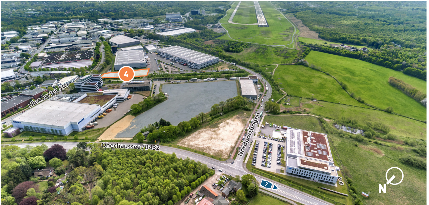
Blick auf die noch verfügbare Fläche im Norden des NORDPORT (B245)