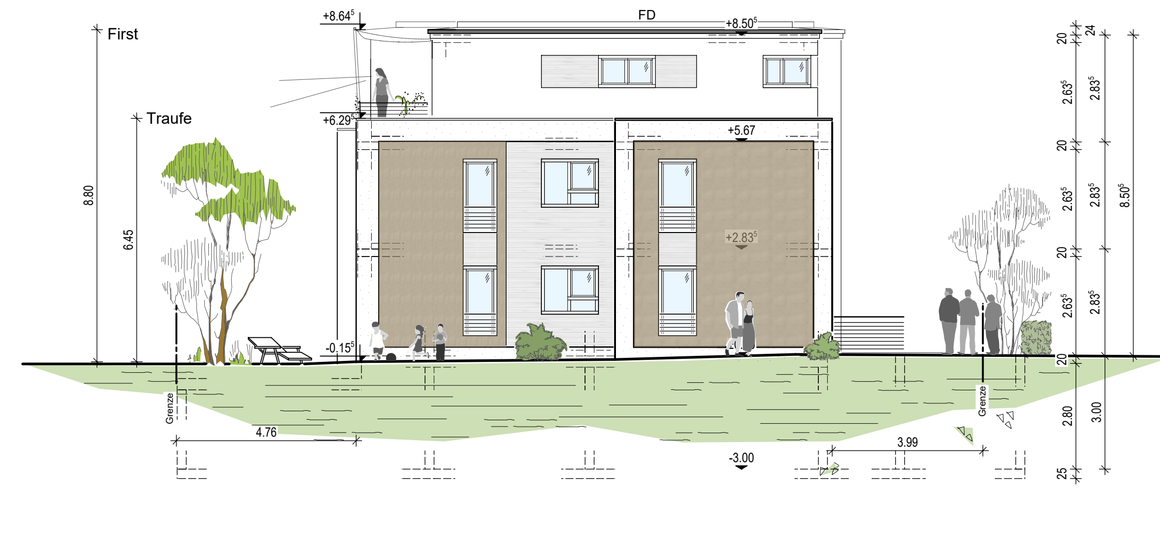
Ansicht von Osten Geb. 1