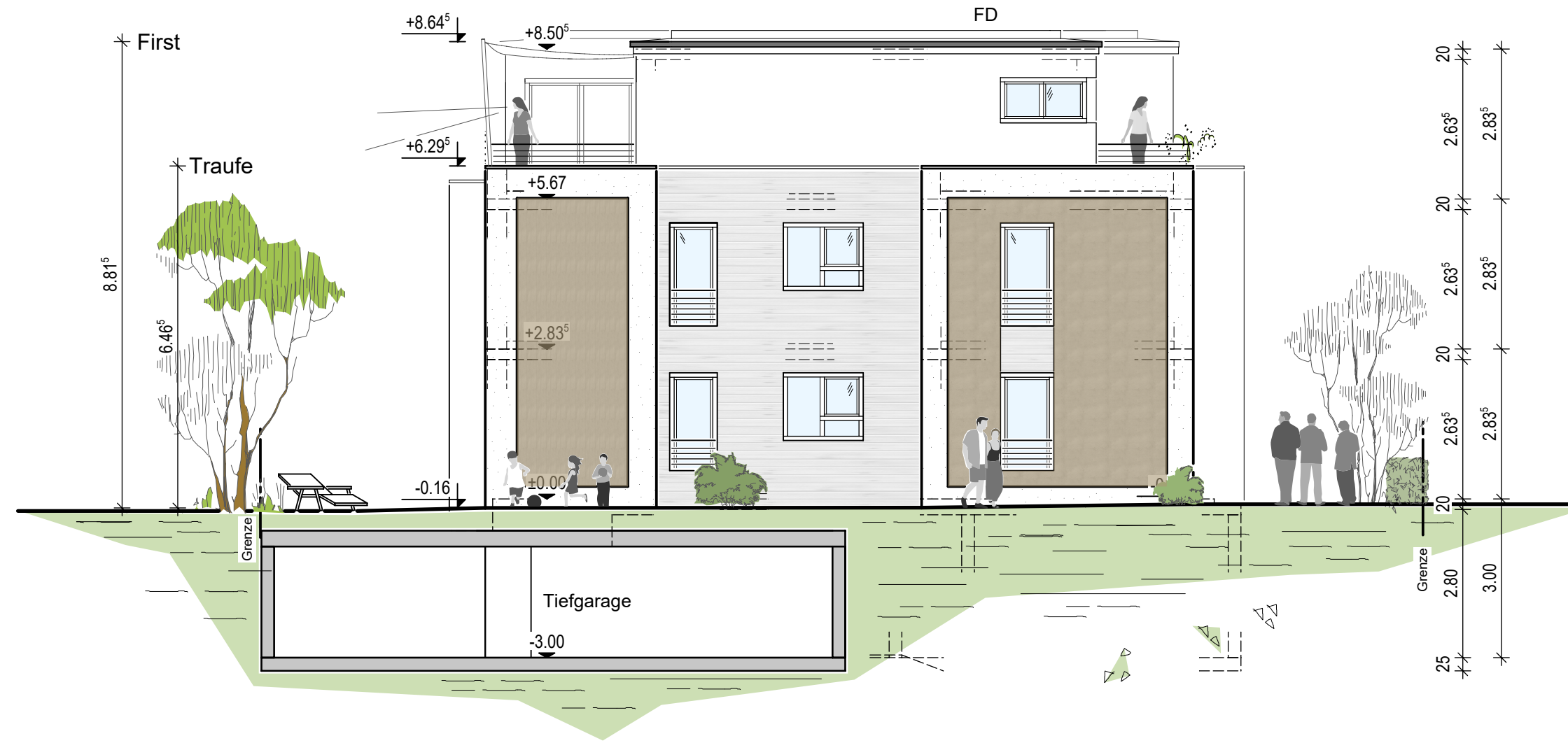
Ansicht von Osten Geb. 2